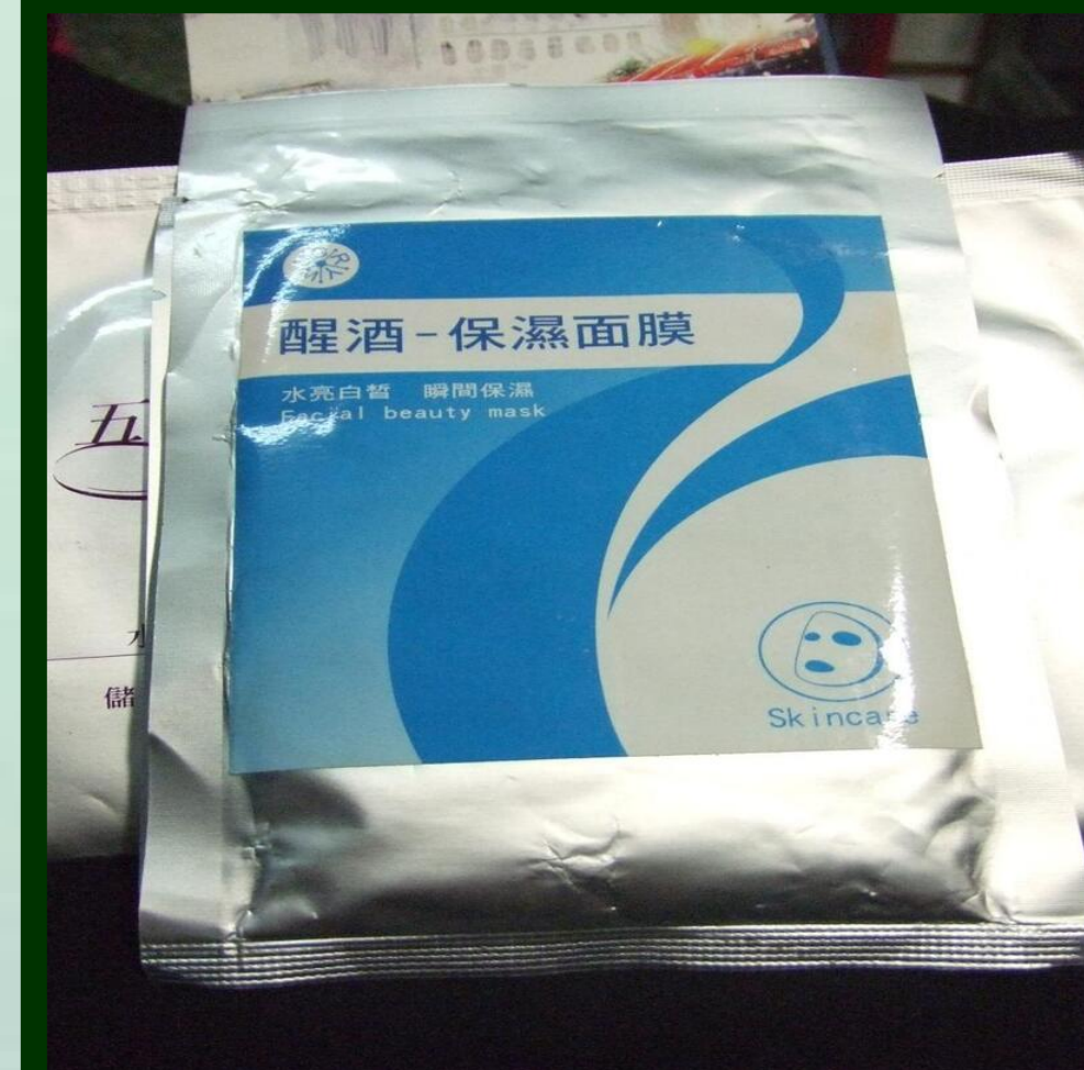
藍海寰宇生技面膜