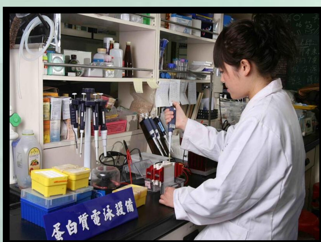
以蛋白質電泳觀察相關蛋白質之表現變化