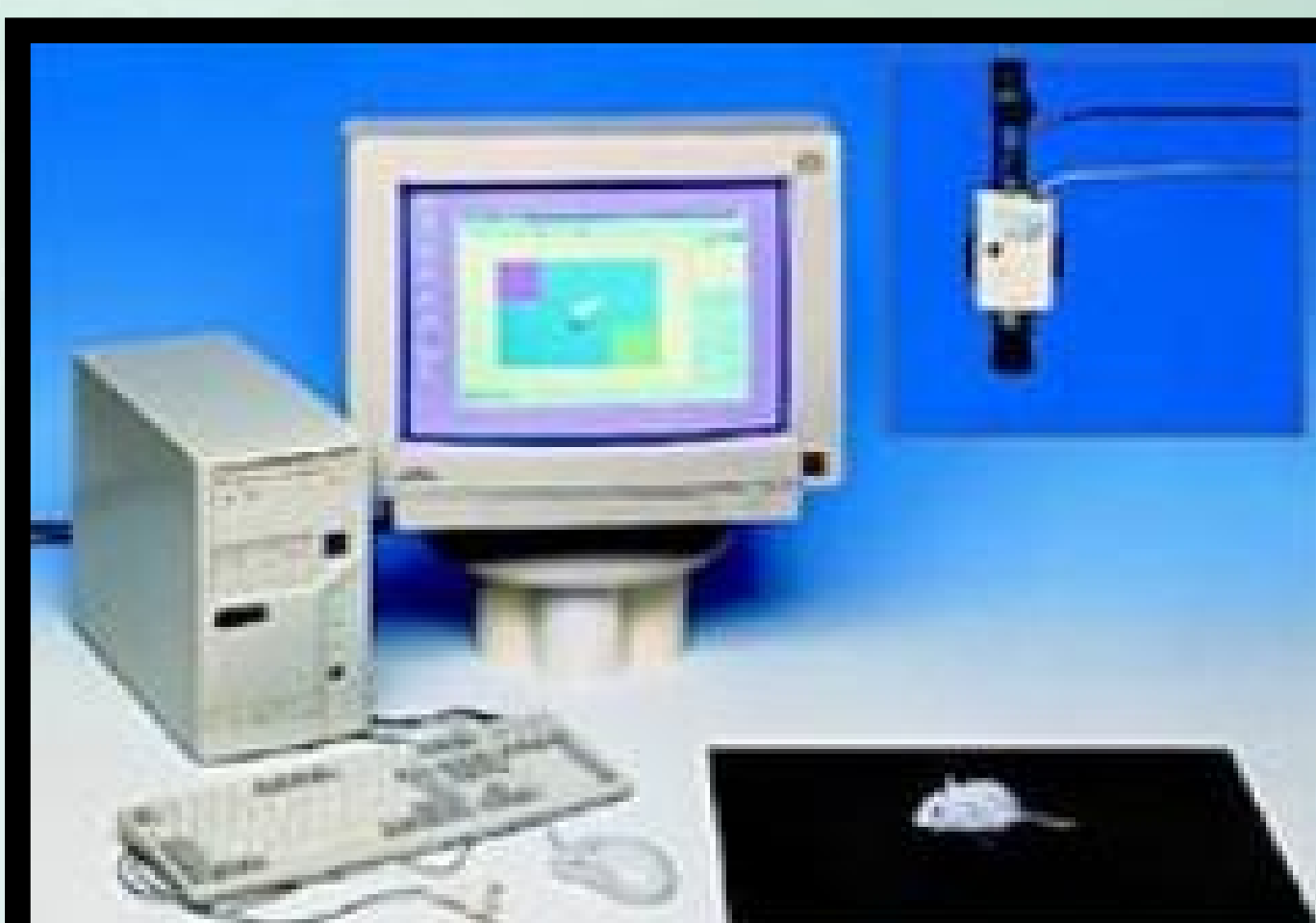
動物行為監測系統 Animal Video Behavior System