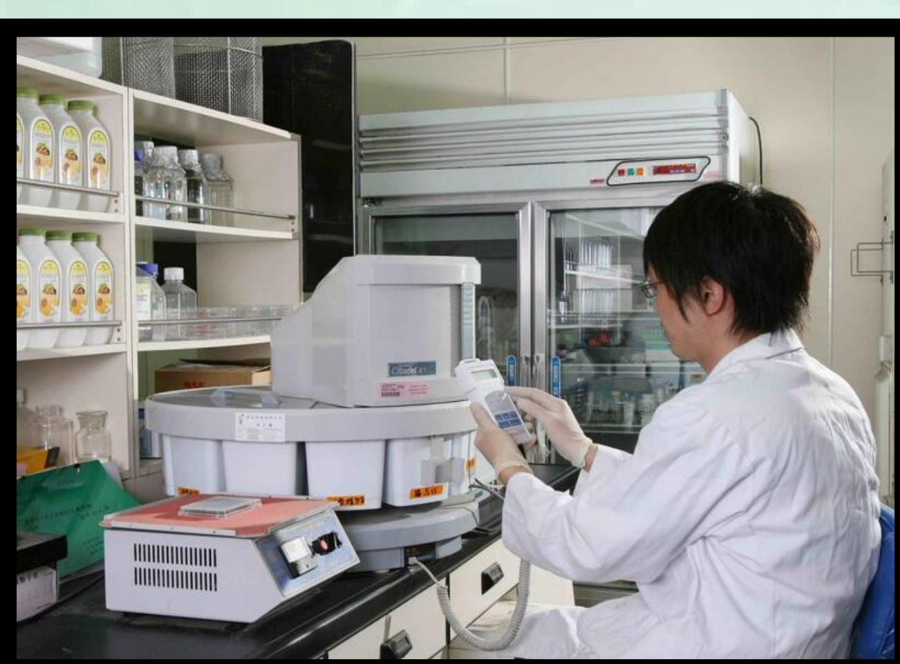
利用微電腦的程式組織脫水機將組織進行脫水滲蠟包埋